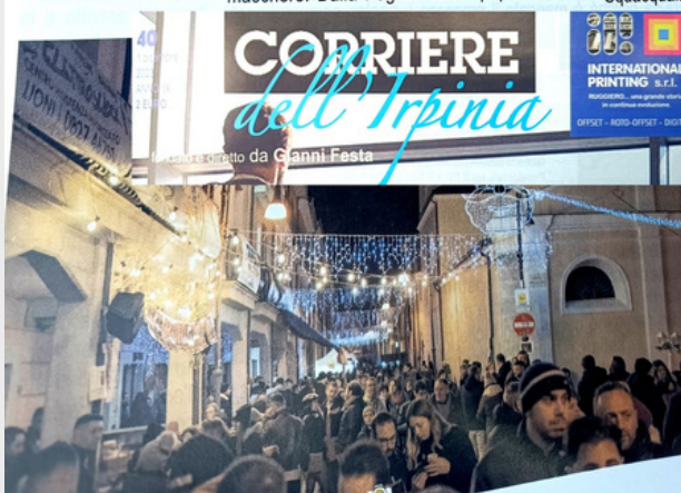
Corriere dell'Irpinia sabato 2 dicembre 2023